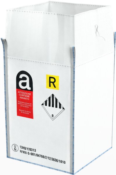
Big Bag Omologati UN Contenitori per rifiuti speciali