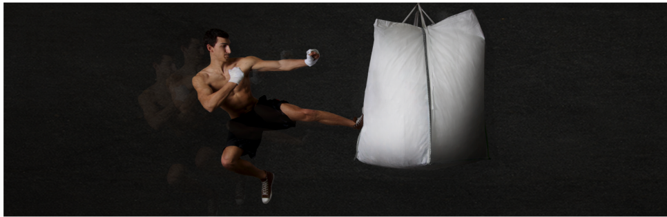
Campagna pubblicitaria 2014