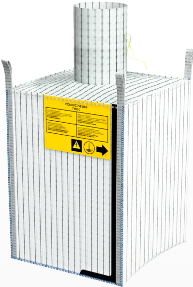
Big Bag Speciali Contenitori con caratteristiche adatte per materiali o esigenze particolari.