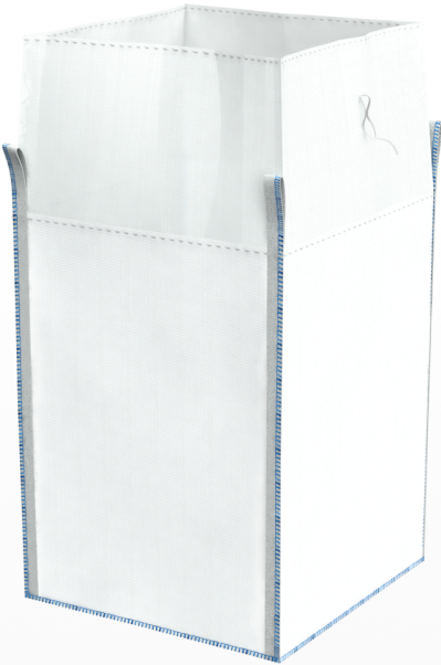
Big Bag Tradizionale