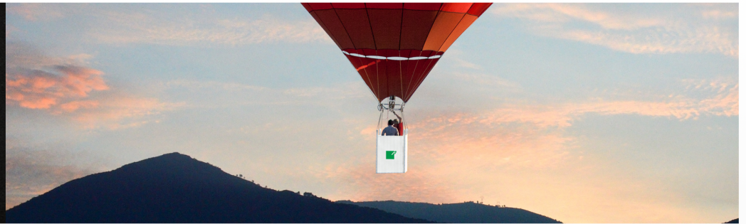
Campagna pubblicitaria 2014 - Rendering e grafiche by Dario Martini